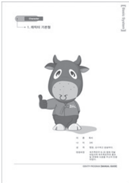
<그림 1> 2003년에 제작된 제주흑우 캐릭터