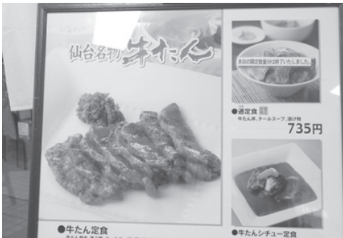
〈그림 3〉 센다이 명품 규탕 홍보물