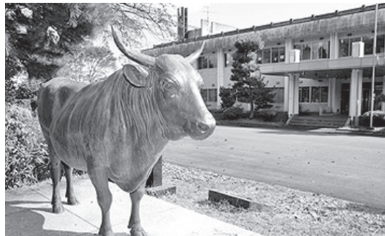
〈그림 4〉 센다이규 유전자의 원조인 씨숫소 동상