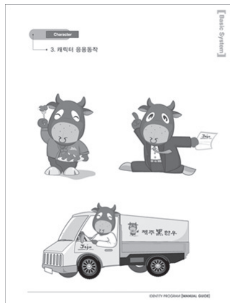
<그림 2> 제주흑우 응용캐릭터