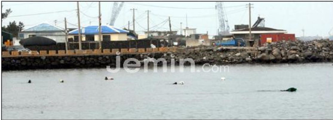
▲ 화북포구에서 물질하는 잠녀들