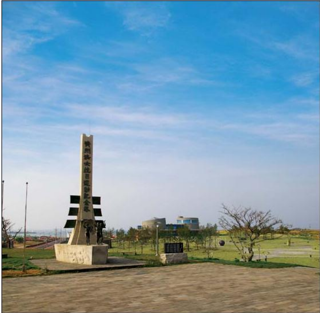
▲ 지난 2005년 조성 완료한 제주해녀항일운동기념공원

광복 50주년 1995년 결성...15년 가까이 잠녀 정신 계승·발전 노력 계속 국가유공자 선정 등 발로 뛰어 "잠녀문화 평가 중요성 제대로 인식해야"