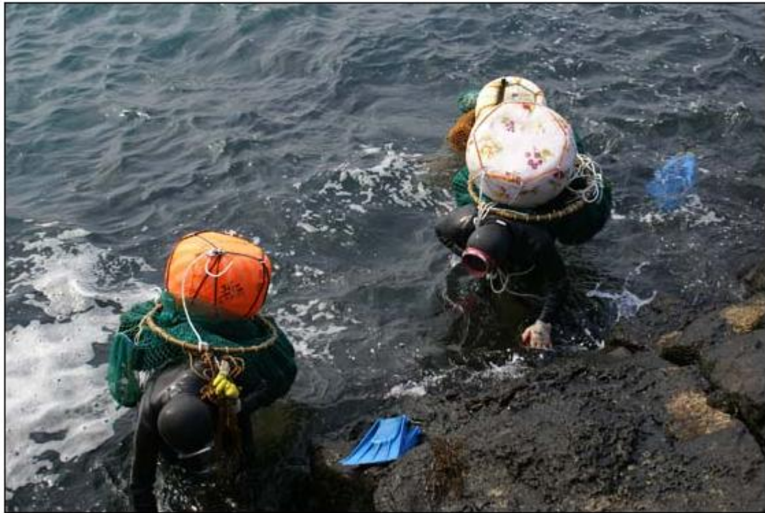
▲ 성계를 채취하고 물으로 나오는 잠녀들

고 김영돈 제주대 교수 1999년 민속원 통해 제주 해녀 다룬 첫 개설서 「한국의 해녀」 발간 1960년대 수산노동자에서 70년대 자유직업인, 80년대 사회문제적 접근 시작 등 계속적 연구 필요